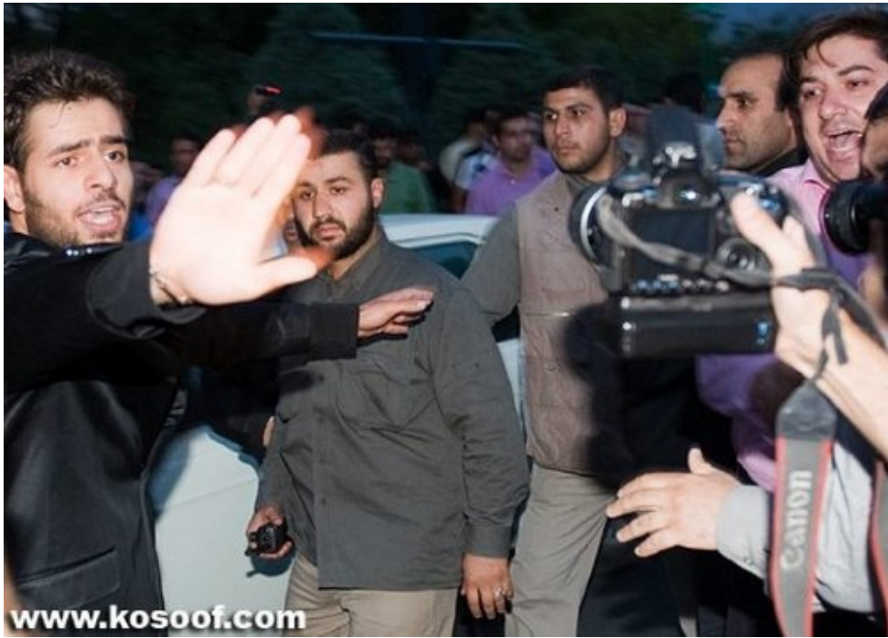
How is he?!!